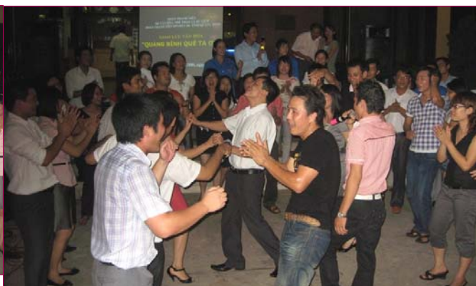
Giao lưu với Đoàn TN Sở VHTTDL Quảng Bình, đoàn viên hát và nhảy rất sôi động. Nhiều trò chơi vui nhộn được các bạn trẻ hưởng ứng nhiệt tình.