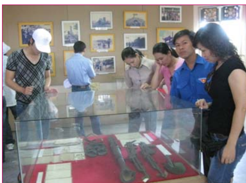
Đoàn Thanh niên hăm Bảo tàng Thành cổ Quảng Trị

Đêm cuối cùng, cả đoàn kéo nhau ra bờ sông Nhật Lệ với bia lạnh và mực phơi 1 nắng. Các tiết mục văn nghệ trăm hoa đua nở. Vui và lưu luyến.