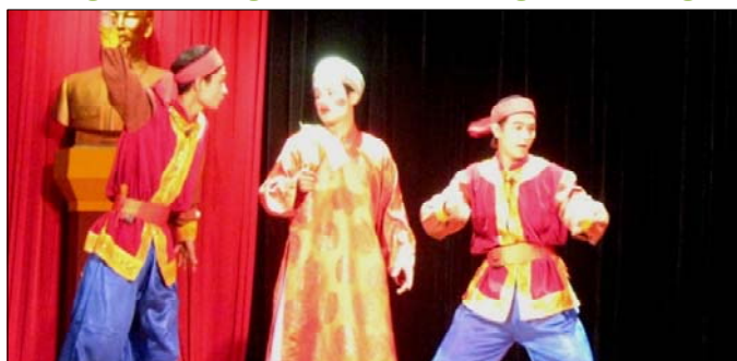
Trích đoạn "Ông già xem hội" của NH Tuồng TƯ