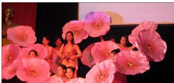
"Người mẹ làng Sen" của Bảo tàng Cách mạng