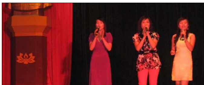
Tiết mục trẻ trung của Thư viện Quốc gia VN