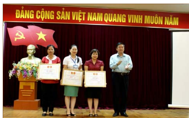
Các cá nhân đạt giải thưởng của Công đoàn Bộ trong cuộc thi 80 năm Công đoàn VN & 15 năm Công đoàn Viên chức VN

Đặc biệt Hội nghị cũng đã trao giải cho các tổ công đoàn đã tham gia cuộc thi viết Những ý tưởng hay về hoạt động công đoàn và hoạt động chuyên môn của TVQGVN. Các bài được giải với tính khả thi cao đã được chọn trình bày trước hội nghị. Điều đáng mừng là có đến 3/4 người trình bày là đoàn viên.