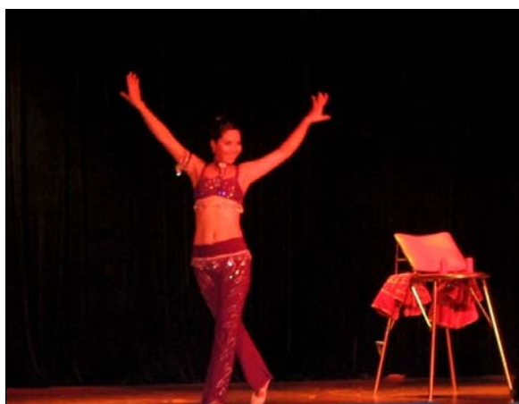
Tiết mục xiếc hấp dẫn của Liên đoàn Xiếc VN