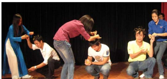
Trò chơi: Ai là nhà tạo mẫu tóc tài ba nhất?