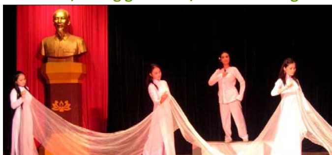
"Người con gái đất đỏ" của NH Cải lương VN