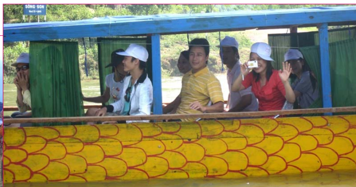
Phong Nha - Kẻ Bàng. Đang ở trong lòng Di sản thiên nhiên Thế giới, môi ai cũng nở nụ cười.